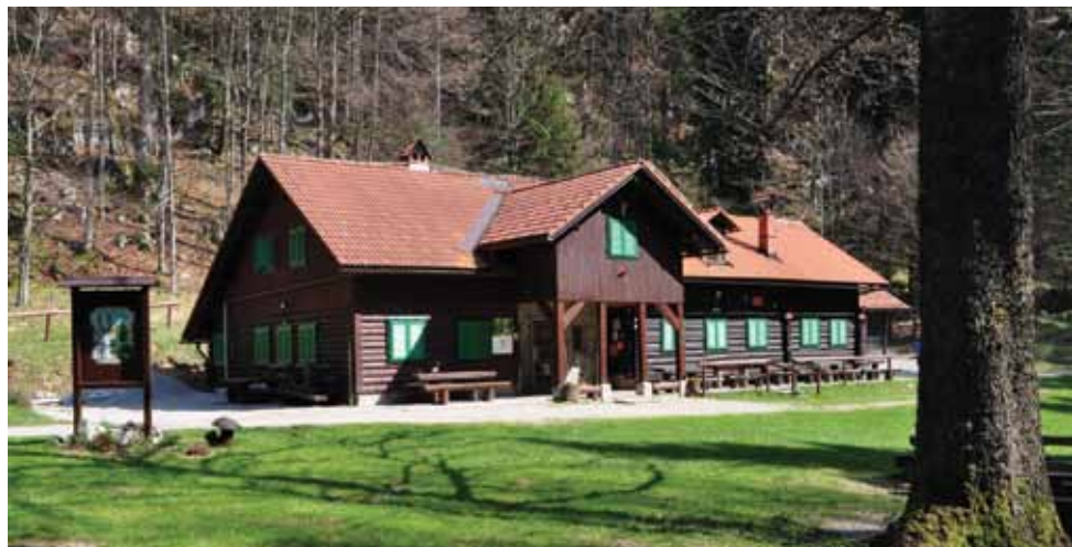
Koča Pri Jelenovem studencu danes

Vodni vir je karnica, oziroma vodo dovažamo iz doline. Zasilni vir je studenec, ki je bil v začetku edini vodni vir za ljudi in živali. Danes je potrošnja vode tako velika, da ne