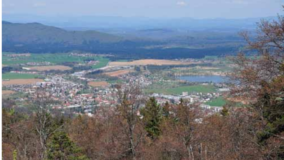
Panorama Kočevja - pogled s Fridrihštajna