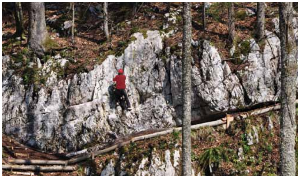
Plezališče nad kočo pri Jelenovem studencu

zadošča za pokritje vseh potreb. Oba gostinska prostora sta ogrevana s pečmi na drva, postojanka ima elektriko iz sončne elektrarne, zasilni vir je električni agregat. V mesecu aprilu je bilo dograjeno plezališče na skali nad kočo, na kateri bodo mladi planinci nabirali izkušnje pred odhodom v visokogorje.