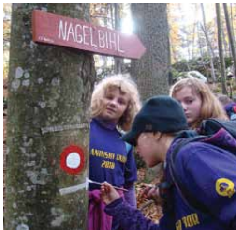
Planinski tabor mladih

Pa smo spet na začetku, to je pri našem jubileju, 60 let delovanja društva. Ob tej priložnosti bomo organizirali več prireditev in dogodkov. Tako bo v Šeškovem domu skupščina PZS, pred kočjo Pri Jelevnem studencu bomo imeli najprej likov-