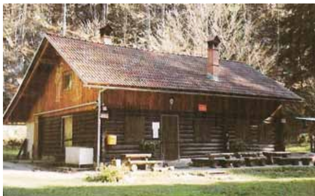
Koča iz leta 1982