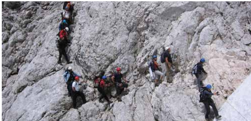
Kočevski planinci pri vzponu na Jalovec