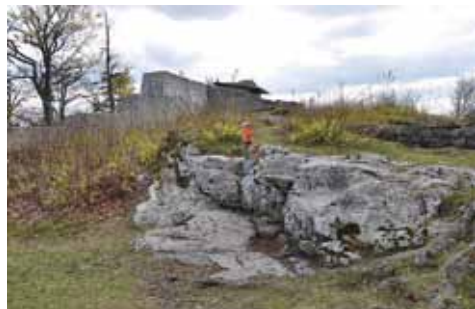
»Veronikin stol« na Fridrihštajnu

Trimčkova planinska pot je lahka pot, primerna za enodnevni družinski pohod. Pozevuje Kočevje s štirimi najbolj obiskanimi vrhovi in kočjo PD. Pričetek je na avtobusni