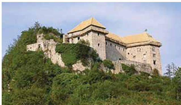
Kostelski grad danes

V listinah se je grad pričel omenjati v letu 1336. Prvotno je služil kot obrambna postojanka, celjski grofje pa so ga razširili v mogočno trdnjavo in ga z naseljem vred obdali z mogočnim zidovjem. Grajski objekt je poleg obrambnega pomena postal tudi pomembna trgovska postojanka. Grad je skoraj 200 let služil kot obrambna točka pred turškimi vpadi.