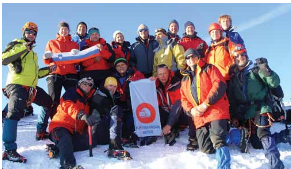
Mont Blanc (4807 m)

diso, na katerem je še isto leto stala tudi večja skupina kočevskih planincev. Za večino je bila to samo priprava za naslednji višji cilj - najvišji vrh zahodne Evrope Mont