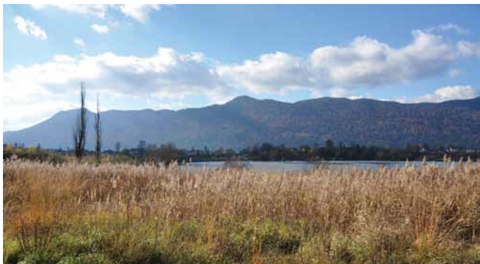
Pogled s Kočevskega jezera na pogorje Stojne. V sredini Mestni vrh, levo Livoldski vrh med njima Fridrihštajn.

Celotna pot je lepo markirana, na vseh križiščih so smerne table. Na vseh kontrolnih točkah so skrinjice z vpisnimi knjigami in žigi. Pot je markirana v obeh smereh, opis je v