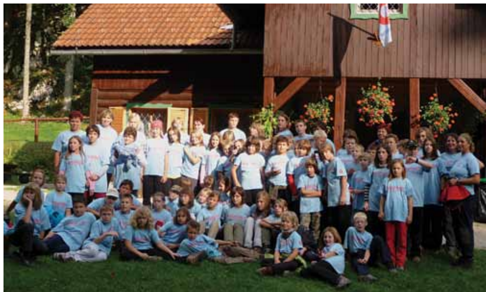
Planinski tabor mladih 2009