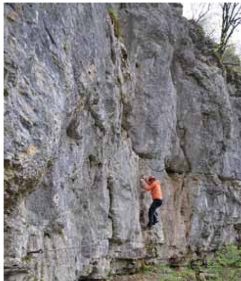
Plezalna pot na Fridrihštajnu (978 m)

postaji v Kočevju (460 m). Najprej obiščemo Livoldski vrh (981 m), nato Fridrihštajn (978 m) in preko Požganega hriba (1009 m) in Mestnega vrha (1034 m) pridemo h Koči PD pri Jelenovem studencu (850 m). Preostane nam še sestop v Kočevje ali po strmi Kalanovi poti ali po položnejši Grajski poti.