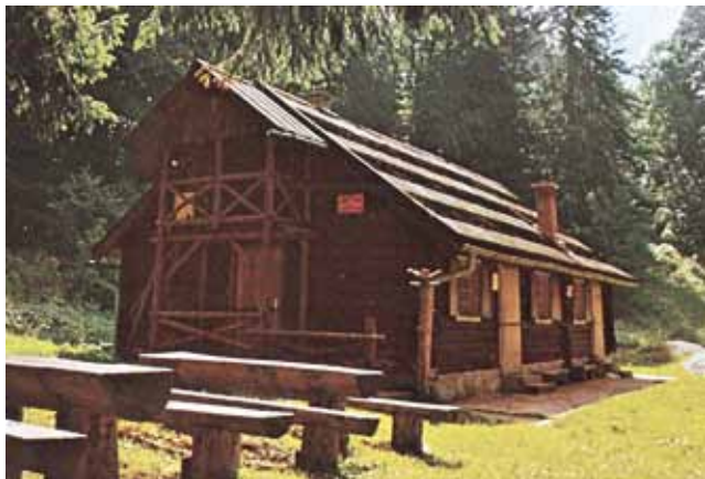
Koča iz leta 1974