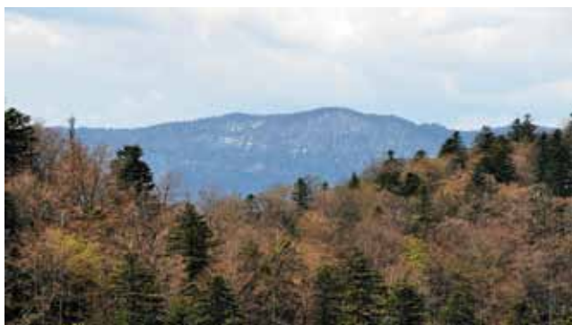
Goteniški Snežnik pogled s Fridrihštajna