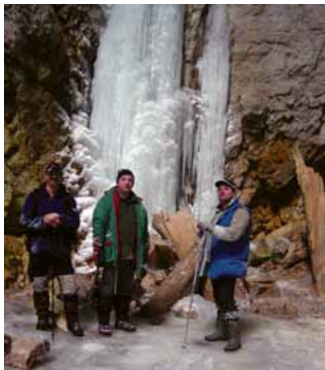
V ledeni jami na Stojni

Loško steno z njenimi edinstvenimi razgledi. Obrnemo se nazaj in nadaljujemo preko Šajbnika do Dragarjev, kjer zapustimo Borovško goro in se napotimo na Goteniško goro.