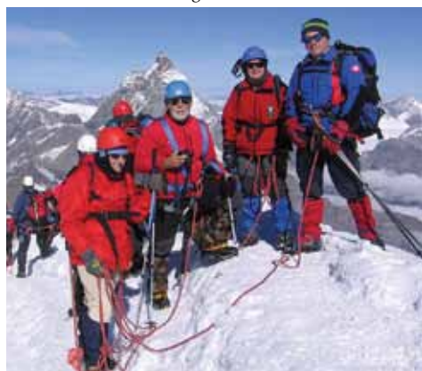
Na vrhu 4164 m visokega Breithorna