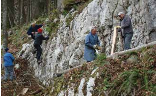
Markacisti pri delu

odseku okoli 130 mladih planincev iz kočevskih osnovnih šol, vključujemo pa še mlade iz Stare Cerkve, Kočevske Reke in Fare. Na mesečne planinske izlete se običajno odpeljemo z dvema avtobusoma, ločeno po kraju in starostnih skupinah. Menim, da je naša organizacija dela v mladinskem odseku lahko vzor kaj se da narediti in da izgovor, da mlade planinstvo ne zanima, tiči le v nedelu starejših.