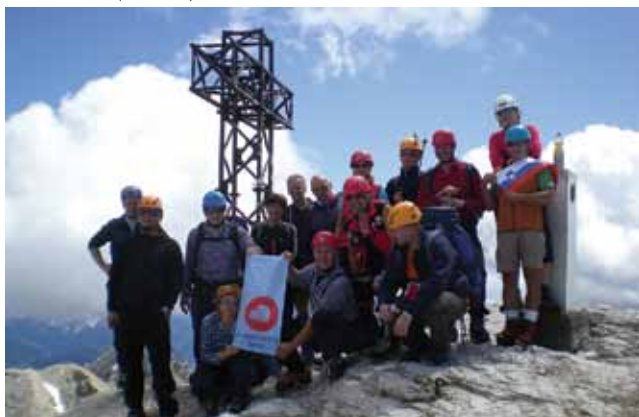
Marmolada (3343 m)