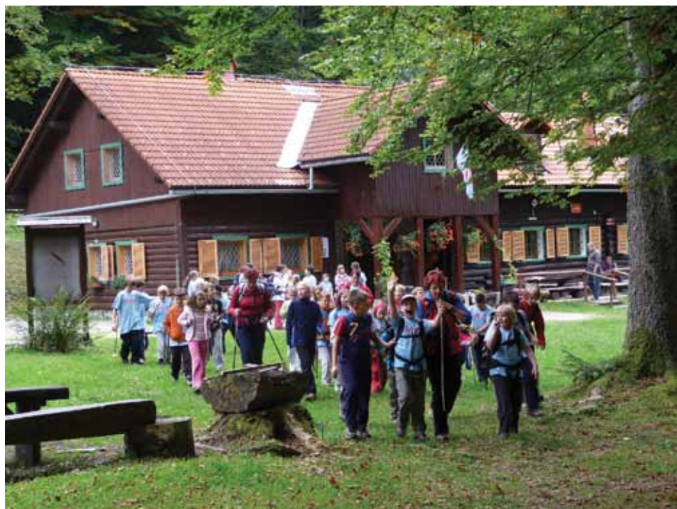
Mladi pred Kočo pri Jelenovem studencu